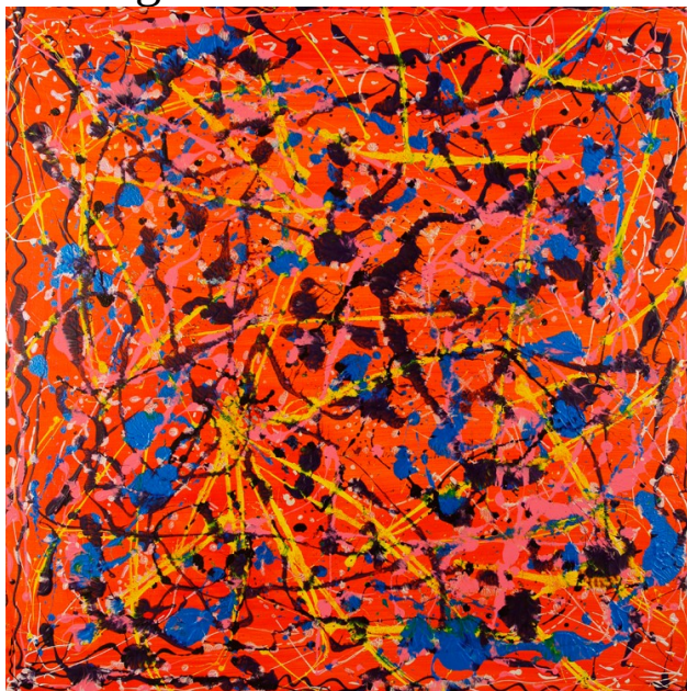
serenata di Jackson Pollock

la figura perde d'importanza e diventano dominanti la materia e il gesto casuale dell'artista